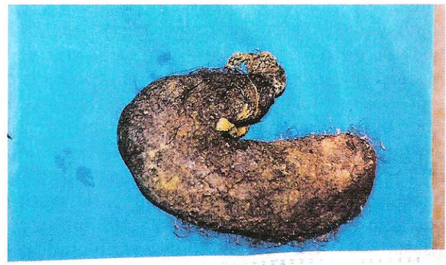
Tricobezoar com a forma do estômago, estendendo-se até o bulbo duodenal