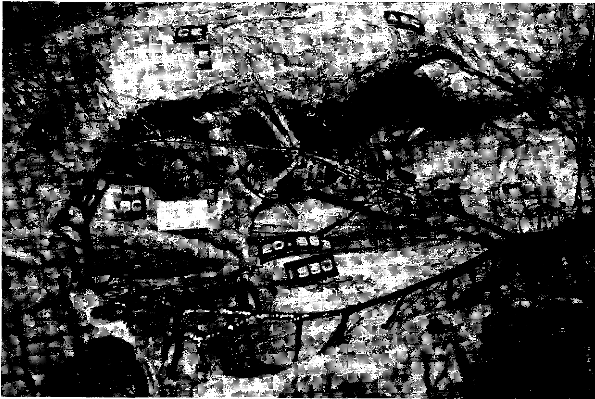
Figura 1: A) Artéria ileocólica. B) A artéria apendicular se origina diretamente do tronco da artéria ileocólica, no local da sua ramificação distal. 1) Tronco da artéria mesentérica superior.

Assim sendo, à medida que formos aumentando mais a nossa casuística, e após essas nossas observações iniciais, esperamos podermos apresentar futuramente, resultados estatísticos da nossa pesquisa, que poderão oferecer bases numéricas mais sólidas da origem da artéria apendicular.